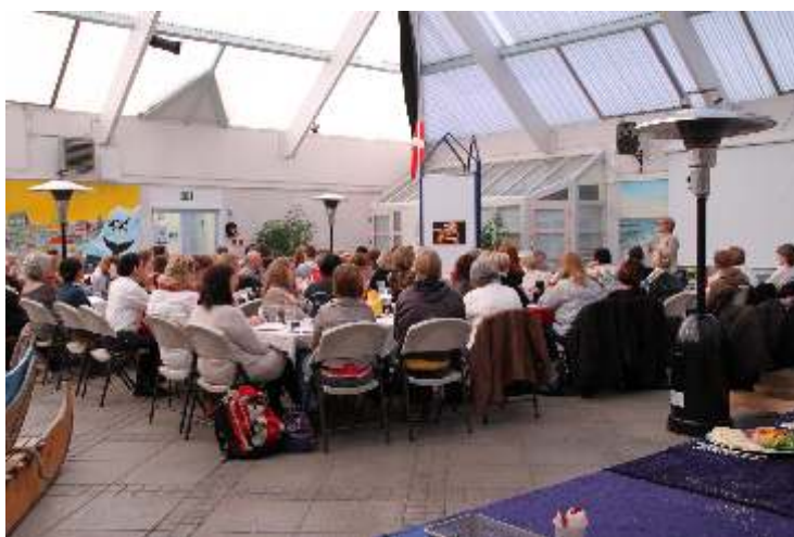
TEMADAG FOR SOCIALFAGLIGT PERSONALE I REGIONEN

182 af de 243 henvendelser kommer fra Aalborg. Der bor flest grønlandere i Aalborg sammenlignet