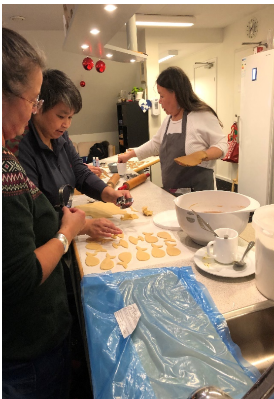
Billeder fra bagning af julesmåkager