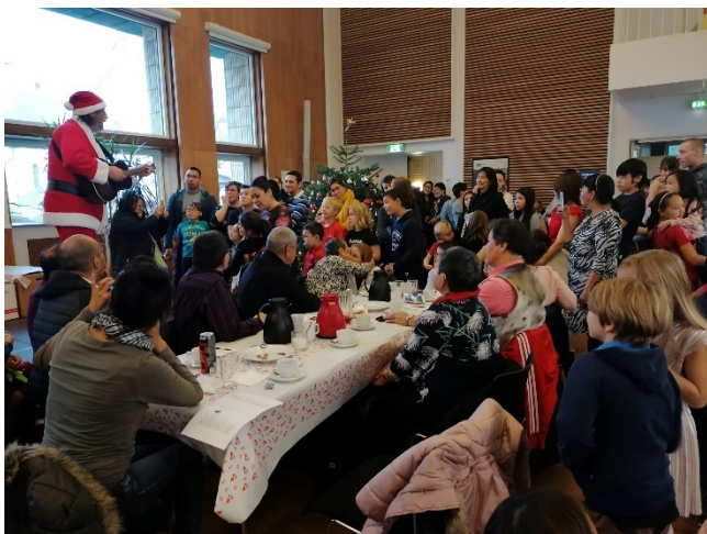
Et af højdepunkterne i kulturarbejdet er årets Julearrangement, hvor vi igen i år havde rigtig mange gæster til julehygge i Budolfi Kirke og Folkekirkens Hus

En stor del af arbejdet har i sagens natur været karakteriseret ved at skulle udvikle og etablere nye samarbejder og arbejdsgange. Arbejdet er dog kommet rigtig godt i gang, og der er tilfredshed og stor tilslutning til vores arrangementer.