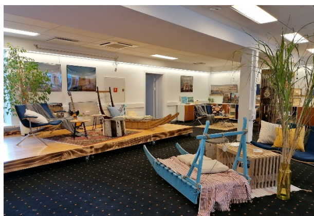
Med den nye indretning vil vi gerne signalere både det moderne og det traditionelle Grønland

Vi er meget glade for, at gæster i huset nu kan gå på opdagelse i formidlingen af Grønland gennem kunst, litteratur og grønlandsk kultur – både den moderne og den traditionelle. Selve biblioteket møder interesse fra husets gæster, ligesom bøgerne passer rigtig godt ind i indretningen.