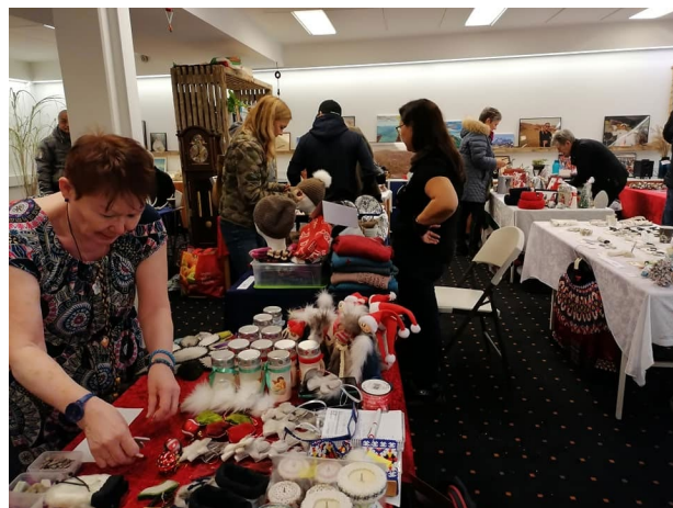
Julemarked er altid meget velbesøgt – både af herboende grønlandere og interesserede handlende.