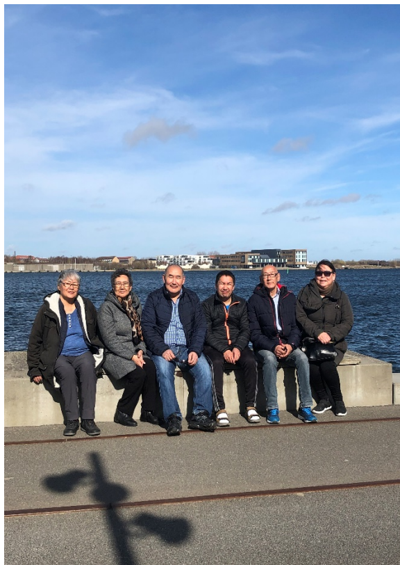
Billede fra tur til biblioteket

Tamatta holder flere af sine aktiviteter på 2.sal, hvor DGH desuden stiller lokaler til rådighed for forskellige foreningsaktiviteter. De grønlandske hjemstavnsforeninger bruger lokalerne til deres foreningsaftener, AA mødes en gang ugentligt, og polka & sangforeningen Paannaat øver flittigt. Koret Ikinngutigiiit bruger lokalet to gange om måneden til fællesspisning og banko for medlemmer, og foreningen for grønlandske studerende Avalak bruger lokalet til deres arrangementer. Lokalet står desuden til rådighed ved kaffemik efter bisættelse for herboende grønlandere.