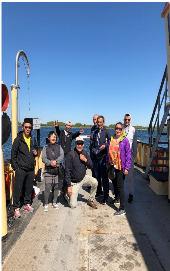
Tamatta på en dagsudflugt til Egholm