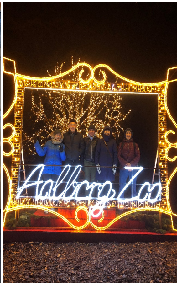
Tamattas tur til lysshow i Aalborg Zoo

Spillerummet står altid til rådighed, og vi har indkøbt nye spil som brugerne flittigt benytter. Af enkeltstående aktiviteter kan nævnes spontane udflugter til friluftsbade, Svømmetur til Haraldslund, lang gåtur til Nørresundby, udflugt til Egholm hvor vi plukkede kvan og lavede grillmad, en dagstur til Sebbesund hvor vi besøgte Kamik Keramik og fiskeri langs havnekajen. I december var vi på en tur til Aalborg Zoo's lysfest, hvor brugerne spiste suppe som Arctic Street Food serverede. Tamatta har indgået et samarbejde med Nordjysk Fødevareoverskud således at vi kan hente mad en gang om ugen. Herved kan gæsterne producere sund mad hver dag til frokost og fælles aftensmad om onsdagen. I oktober blev det besluttet at frokost og fællesspisning er gratis.